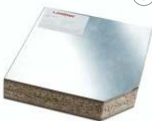
Плита из ДСП (Ligna K38 AL AL) сверху и снизу фольга

Основа – ДСП, плотность 620 кг/м3; Сверху-алюминиевая фольга; Снизу-алюминиевая фольга. Рекомендуется в сочетании с ковровой плиткой.