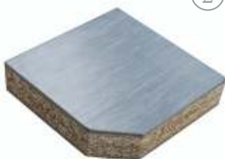
Плита из ДСП (Ligna K38 AL)

Основа -ДСП, плотность 620 кг/м3 Основа-ДСП, плотность 620 кг/м3 Сверху-антистатический ПВХ; Снизу -алюминиевая фольга.