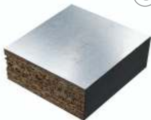
Плита из ДСП (38НАА) - as620

Основа -ДСП, плотность 620 кг/м3 Сверху-алюминиевая фольга, Снизу-алюминиевая фольга. Рекомендуется в сочетании с ковровой плиткой.